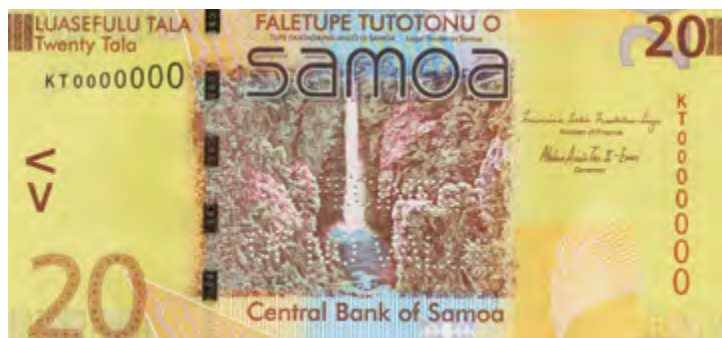
萨摩亚的 20 塔拉纸币荣膺设计大奖。该版纸币以国鸟齿鹑、国花红花月桃和 Sopoaga 瀑布为主要图案。