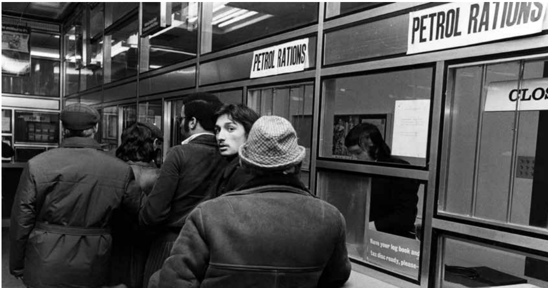
Queue pour les bons d'essence à la poste de Hanover Street à Liverpool, au Royaume-Uni, le 29 novembre 1973.